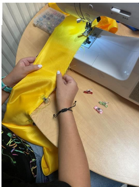
Atelier couture : réalisation des écharpes