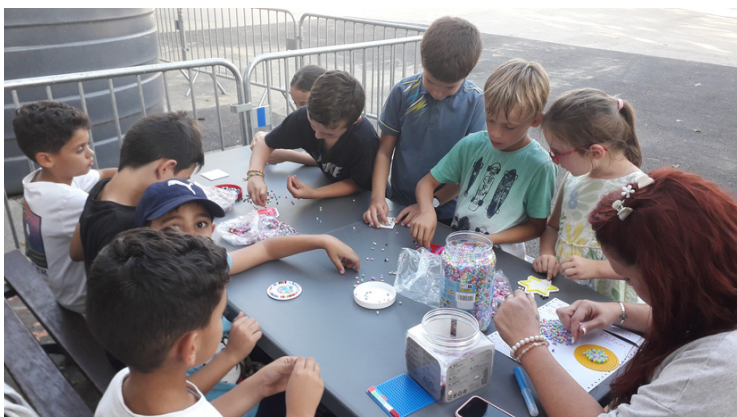
Atelier perles à repasser