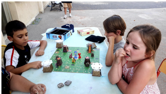
SOS Dino, le jeu de société où il faut sauver des dinosaures